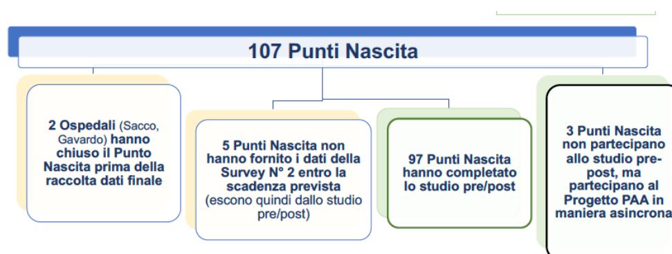
Figura 2. Aggiornamento ad aprile 2025 sul Progetto PAA.