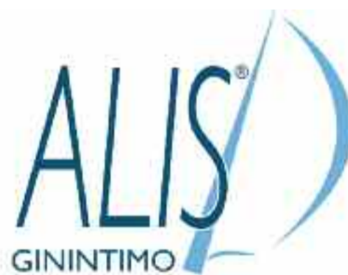
Eutrofico Igienizzante Intimo

Eutrofico - Multifunzionale il primo probiotico - antiossidante a difesa dell'ecosistema vaginale