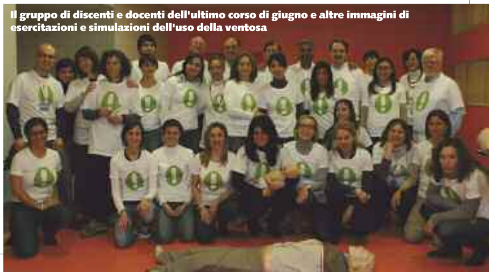
Il gruppo di discenti e docenti dell'ultimo corso di giugno e altre immagini di esercitazioni e simulazioni dell'uso della ventosa

www.gruppoemergenzeostetriche.it Le diapositive delle lezioni frontali del corso e di alcune relazioni a congressi sui temi dell'emergenza/urgenza in ostetricia sono pubblicate sul sito del gruppo Geo