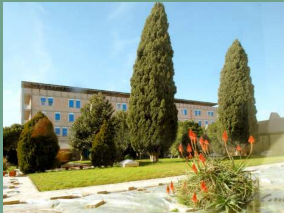
Hotel Villa EUR Parco dei Pini Piazzale Marcellino Champagnat, Roma

Per iscriversi è necessario effettuare la procedura online sul sito www.hdcons.it , oppure compilare la scheda di iscrizione allegata e inviarla via email a segreteria@hdcons.it o via fax allo 011 0267954.