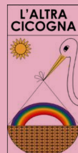
Associazione L'altra Cicogna