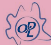
Ordine degli Psicologi della Lombardia