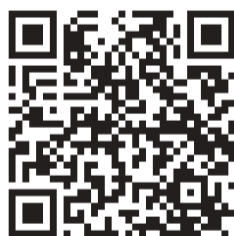
Link al Rapporto Istat

IL 2024 SI CONFERMA un anno di trasformazione per la demografia italiana. I segnali di allarme sono molteplici: una natalità ai minimi, una popolazione sempre più anziana, un tessuto familiare che cambia e una mobilità che accentua le disuguaglianze territoriali. Boom di emigrazioni italiane: raggiunta quota 191mila (+20,5%) soprattutto verso Germania, Spagna e Regno Unito. Segnale positivo sul fronte della salute: la speranza di vita torna a crescere, raggiungendo gli 83,4 anni, con un guadagno di 5 mesi rispetto al 2023. Questo in sintesi il quadro demografico italiano tracciato dall'Istat nel report Indicatori demografici 2024.